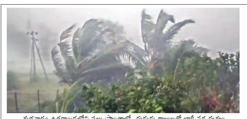
శుక్రవారం ఉత్తరాంధ్రలోని పలు ప్రాంతాల్లో ఈదురు గాలులతో భారీ వర్ష దృశ్యం