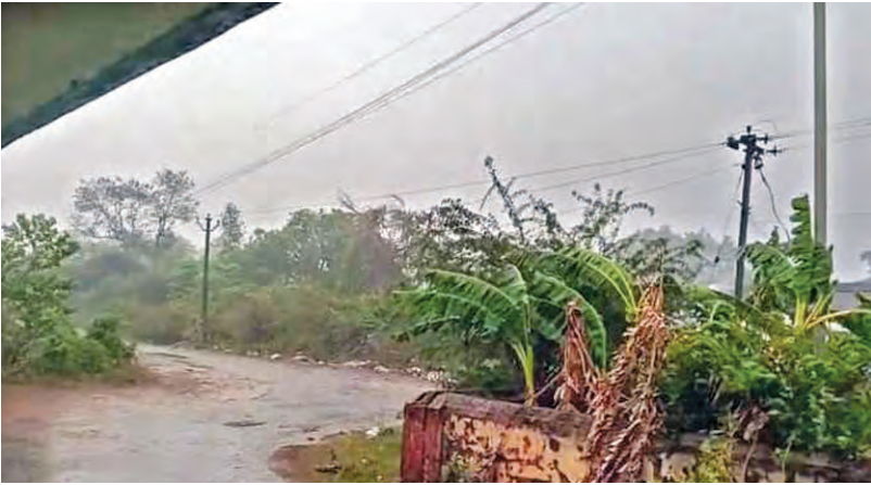
శుక్రవారం ఉత్తరాంధ్రలోని పలు ప్రాంతాల్లో భారీ వర్షం దృశ్యం

>>> శాతం పూర్వాయుని డిసెంబర్ నాటికి నిర్మాణం పూర్తి చేసి కృష్ణా జిల్లా అభివృద్ధిని నెట్టి లెవెల్ కు తీసుకొమ్మని వెల్లడించారు. భారత్ మాళా ప్రాజెక్టులో భాగంగా మచిలీపట్నం బైపాస్ 6 లైన్లుగా అభివృద్ధి చెందనుందని తెలిపారు. హైదరాబాద్ మచిలీపట్నం హైవే ఎక్స్ ప్రెస్ రోడ్డుగా అభివృద్ధి చెందుతుందని అభిప్రాయం వ్యక్తం. రాష్ట్రాన్ని పునర్నిర్మాణం ఎన్నికల్లో హామీ ఇచ్చాం. ఆంధ్రప్రదేశ్ కు పునర్నిర్వేషణం తీసుకొమ్మని హామీ ఇచ్చాం.