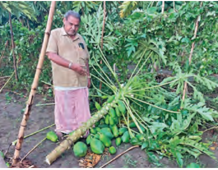
ఈదురుగాలులకు నేలకూలిన బొప్పాయి పంట

సంతోషవైకృత/బూర్గ (శ్రీకాకుళం జిల్లా), మే 1 ప్రభాతవార్త: శ్రీకాకుళం జిల్లా సంతోషవైకృత, బూర్గ మండలాల్లో అకాల వర్షం ధాటికి భారీ నష్టం వాటిల్లింది. సంతోషవైకృత మండలంలో గత రెండు రోజులుగా ఉరుములు మెరుపులతో కూడిన గాలివానతో ఉప్పుకుప్పలు సీలమునిగాయి. దీంతో ఉప్పు రైతులకు అపార నష్టం వాటిల్లి అప్పుల ఊబిలో కూరుకుపోయారు. మండలంలో నౌపద, సిఠానగరం, శిలగపేట, మర్రెపాడు గ్రామాల్లో పలువురు ఉప్పు రైతులు ఉప్పు పంట సాగు చేస్తున్నారు. వేలికి అందవచ్చిన పంట మడులలోనే గంగనాలు అవటంతో 50శాతం పైగా ఉప్పు పంటకు నష్టం వాటిల్లిందని లభోగి బోమంటున్నారు. వర్షానికి పూర్తిగా ఉప్పు మడుల్లో వర్షపు నీరు చేరడంతో మరో పది రోజుల వరకు ఎటువంటి పని ఉండదని, ఉప్పునిల్లు చేసేందుకు ప్లాట్ పాటు లేకపోవడం వంటిన పంటకు రక్షణ లేకపోవడంతో ఈ పరిస్థితి నెలకొందని రైతులు ఆందోళన చెందుతున్నారు. అలాగే ఆరుగలం కట్టనుండి వండించుకున్న మామిడి, బొప్పాయి వేలికి అంది వచ్చే సమయంలో ప్రకృతి వైపరీత్యంలో చెట్లు నేలకొరిగి కాయలన్నీ రాలిపోయి తీవ్ర నష్టం ఏర్పడింది.