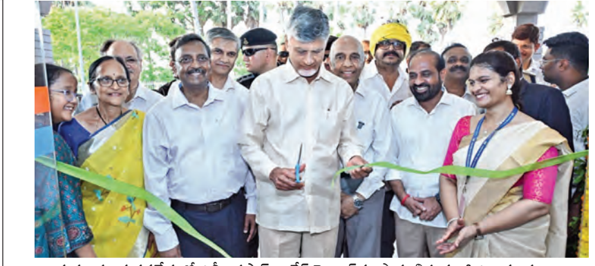
శుక్రవారం గుడ్లపల్లెలో ఎల్వీ ప్రసాద్ ఐ కేఆర్ సెంటర్ను ప్రారంభిస్తున్న సీఎం చంద్రబాబు